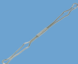
Draht-Niederhalter NH 80 / Wire compressor bars NH 80